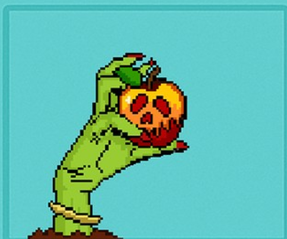
Bad Apple Tem gosto de veneno.