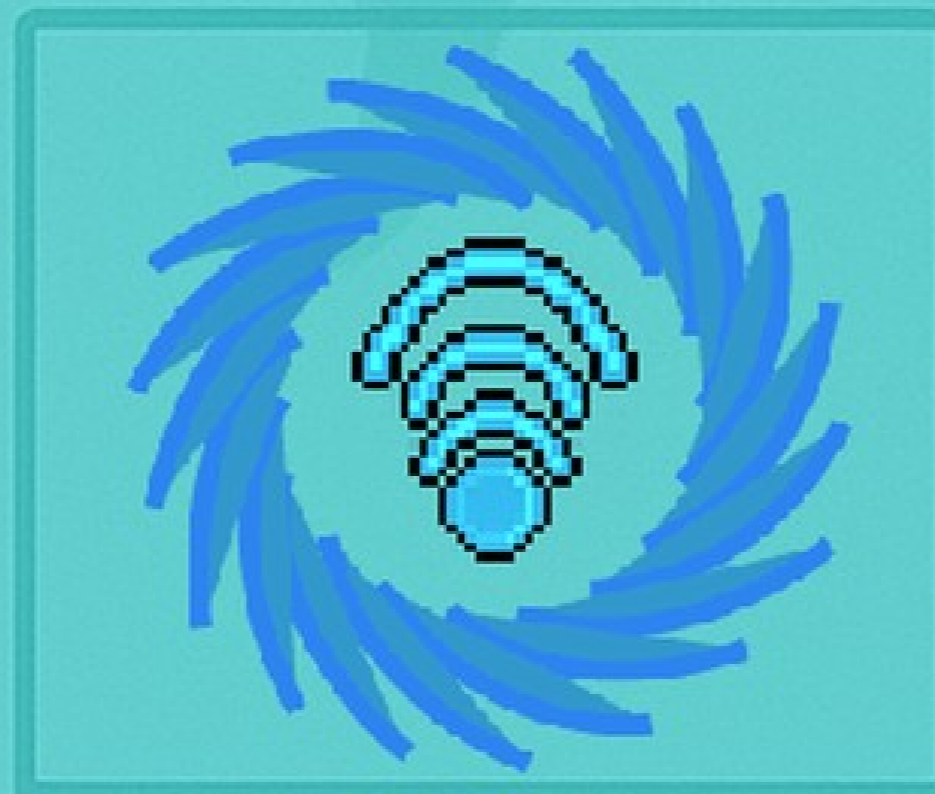
SweetSonar Revela segredos.