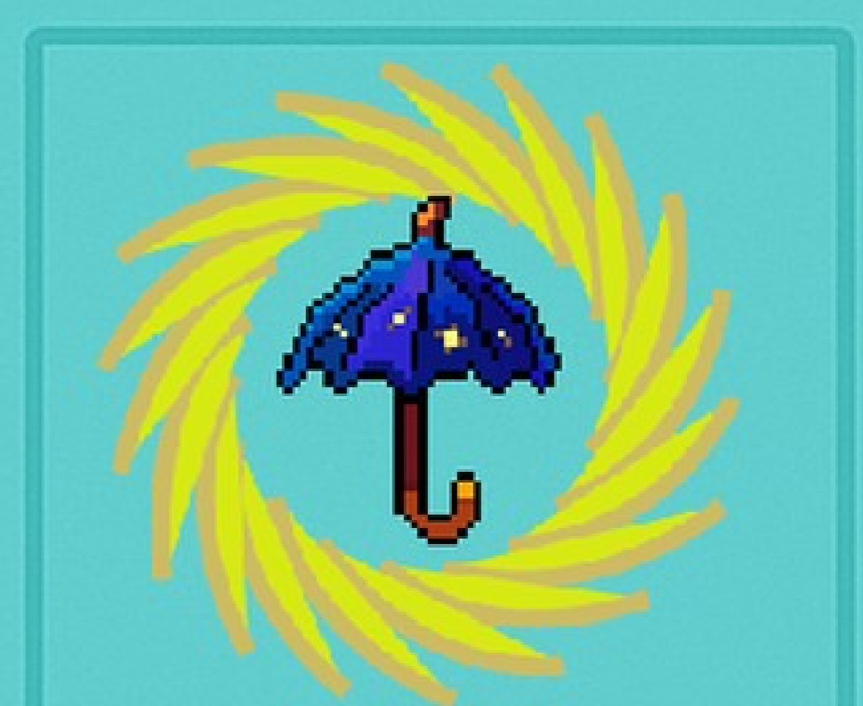
The Sizzle Stopper O sol odeia isso.