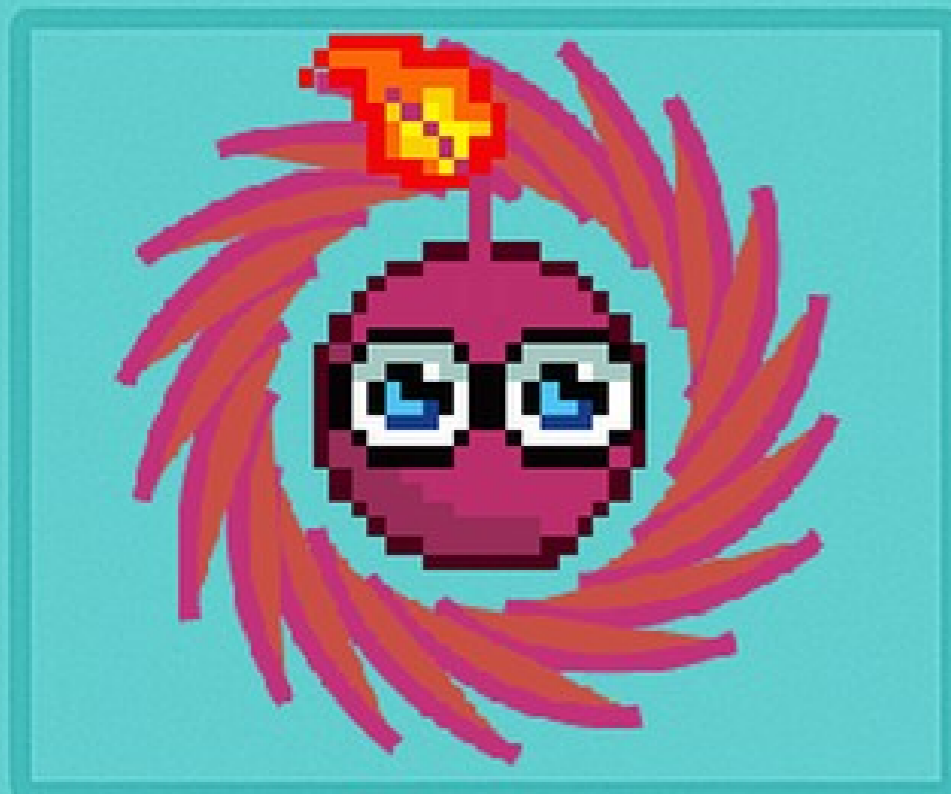
BEETdown Bomb Puxe o talo. Bum!