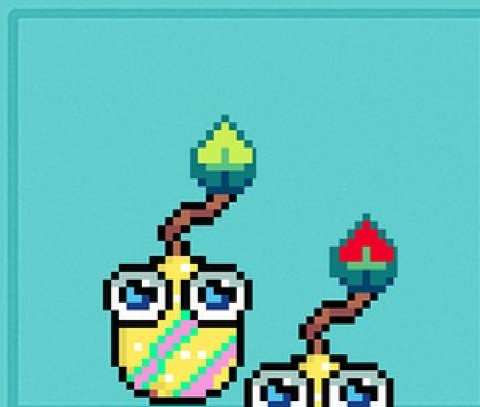
Eggsploders Óbvio, com trocadilho e mortal.