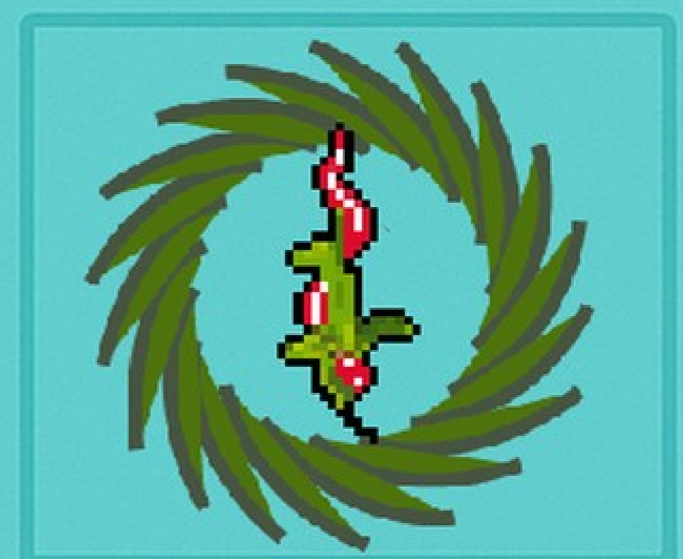
Root Awakening Surpresa espinhosa de fita.